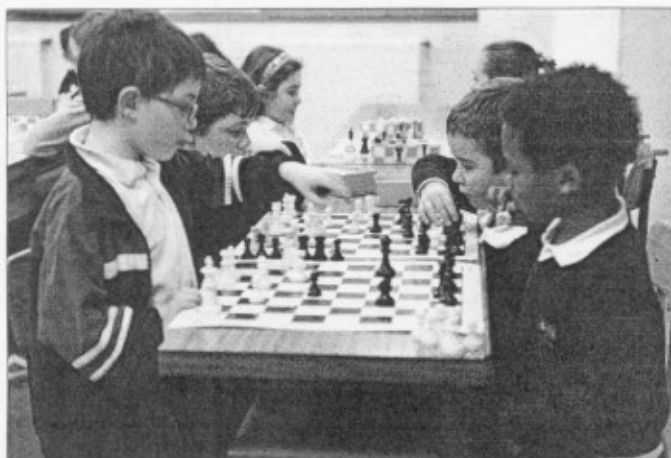
El Club Kostka de ajedrez es uno de los más reputados de la región y compite en torneos nacionales e internacionales