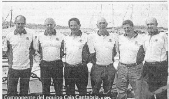
Componente del equipo Caja Cantabria. en